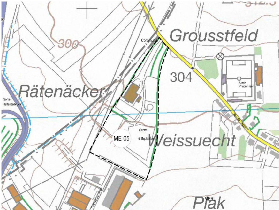
Fond de plan: Administration du Cadastre et de la Topographie, 2008