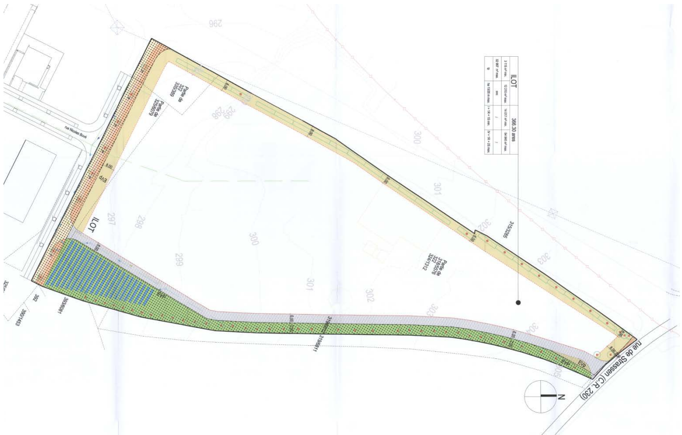
Source : PAP «Rue Nicolas Bové» à Luxembourg, partie graphique – ME Architectes