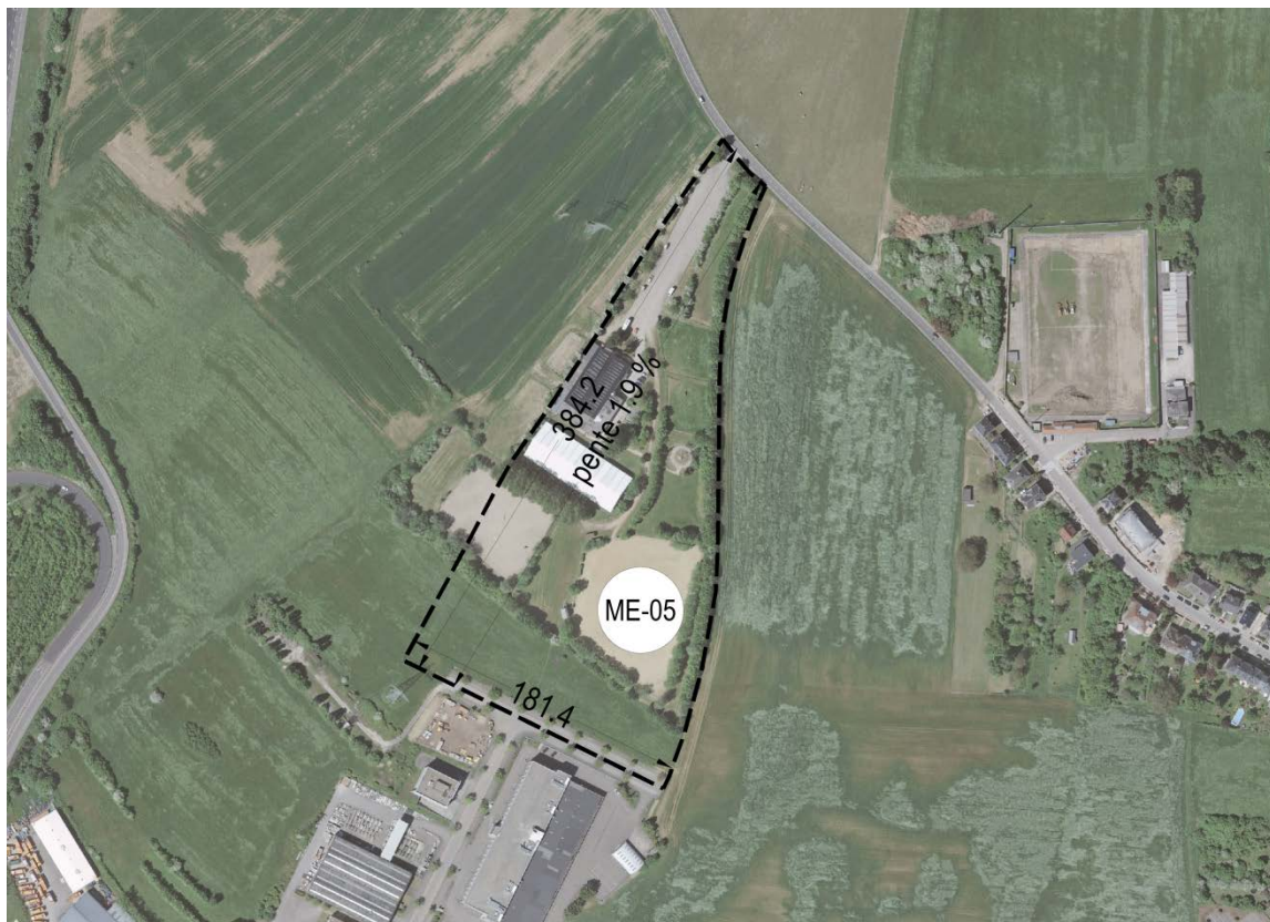
Fond de plan: Ville de Luxembourg – Service de la Topographie et de la Géomatique, Orthophotos digitales 2013